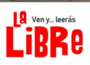
PUNTO de LECTURA "Jardín de Invierno Centro Multifuncional (3ª planta)