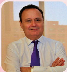
Ángel Viveros Guitérrez Alcalde de Coslada